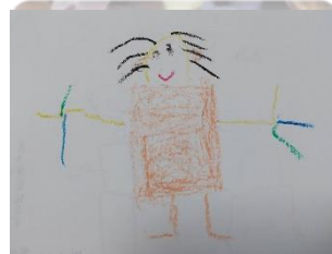
唯倪：身體地圖，有手、腳、身體還有頭髮跟耳朵