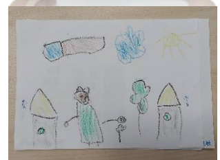
好喬：家附近的地圖