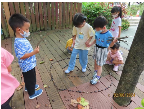
試著走走看夠不夠寬。