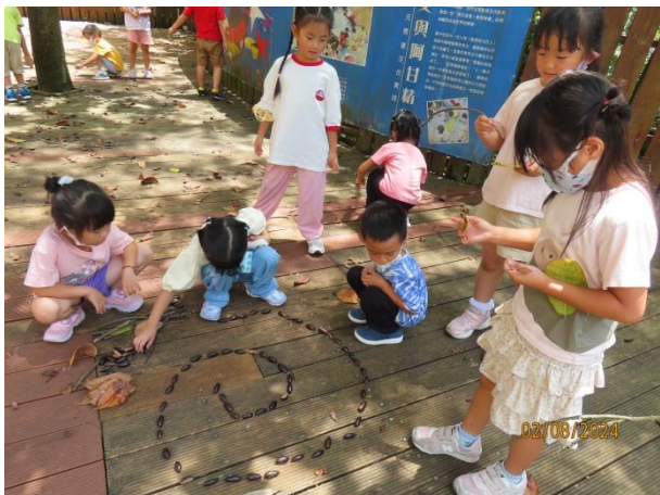
用福木的種子一起擺放出螺旋狀。