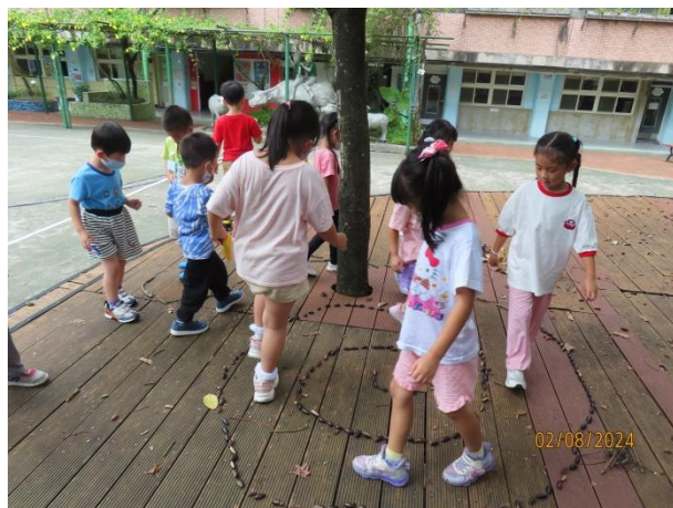
完成了大家一起來玩！

透過自然素材的鋪排，讓孩子們體驗不同的美感經驗，而在鋪排植物過程，孩子們從中發現問題，並一同解決問題，最後一起遊玩，藉由遊戲培養孩子們探索解決問題的能力！