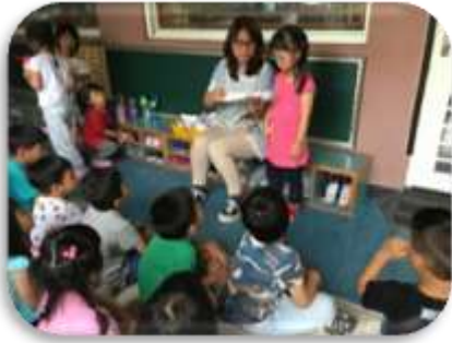
介紹自己的紙飛機

「我爸爸也會摺紙飛機，跟我們摺的不一樣」「老師，你會摺不同的紙飛機嗎？」但老師只有紙飛機的基本款，我們在聯絡單上邀請家長與我們一起摺紙飛機。週一小朋友帶了各式各樣的紙飛機，我們請小朋友介紹自己帶來的紙飛機，小朋友把紙飛機依照大、小，形式、材質上的不同進行分類。